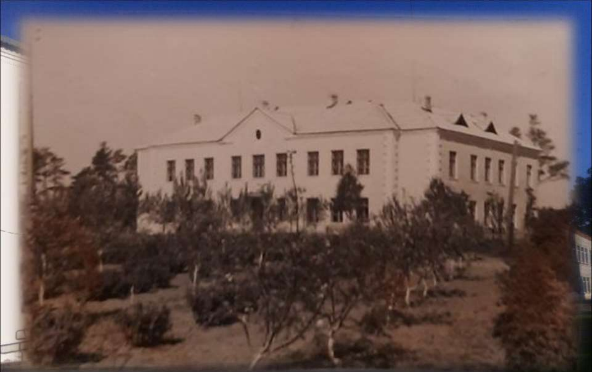
Катынская школа в 1952 году