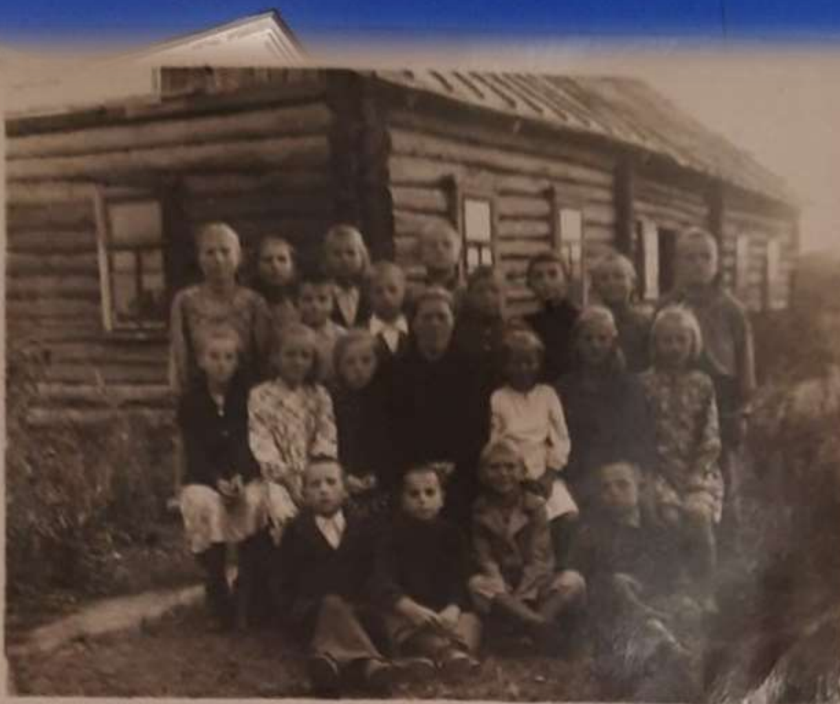
Катынская школа в 1946 году