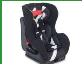
Автокресло группы I для детей массой 9-18 кг