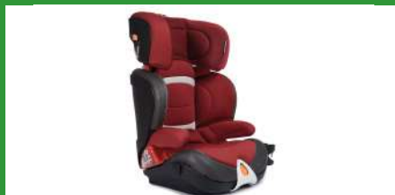
Автокресло группы III для детей массой 22-36 кг (возможно использование бустера)