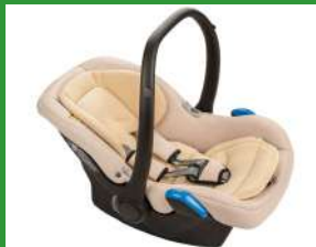
Автокресло группы 0+ для детей массой менее 13 кг